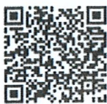
QR Code ลำดับที่ ๑