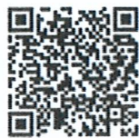
QR Code ลำดับที่ ๒